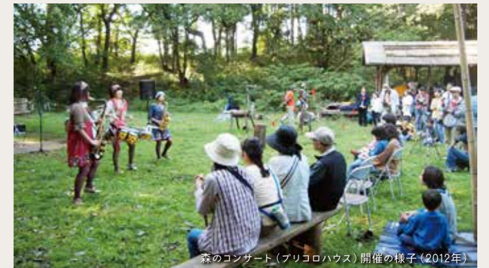
森のコンサート(プリコロハウス)開催の様子(2012年)

森ならではの環境で、美術館やギャラリーとは異なった鑑賞体験をできるのが魅力ですね。私たちの活動は17年の歴史を持っています。今年は継続して関わってくださっている作家6名と、初参加の作家が6名で展覧会を行います。長期間滞在制作する参加者が作り上げる、森という場所ならではのアートが展覧会の特徴ですので、参加作家にはぜひ制作の裏話を聞いてみてください。継続参加の塔をテーマとする作家や、昨年は森に庭をつくるプロジェクトを行った作家は、それぞれ昨年のテーマをより深めて新しい展開をつくりあげています。毎年訪れてくれる人にも楽しんで頂ける内容になっています。どんな形になるかは見てのお楽しみ。受付にマップがありますので、それを手に森を散策しながら作品を鑑賞してください。