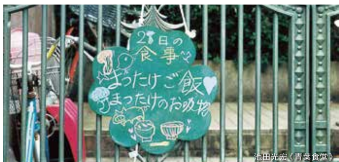
池田光宏《青葉食堂》

その日の晩ご飯を黒板に書き込んで玄関先に掲示するアート作品《青葉食堂》。アーティストの池田光宏が2008年に制作し、いまでも地域で親しまれている《青葉食堂》を目印に、黒板を掲示しているお宅に訪問して晩ご飯のお裾分けをいただくアートツアーを開催。