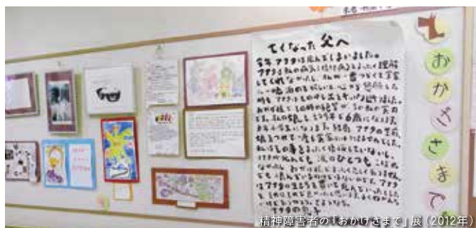
精神障がい者の「おかげさまで」展(2012年)

精神障がい当事者、地域の方、スタッフが、文化活動を楽しむメンバーとして、コンサート、朗読会、展覧会を開催。コンサートや朗読会はいずれも出演者や観客の枠をとり払った、気軽な交流の場となる。展覧会は精神障がい当事者が企画の中心となり運営される。