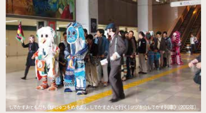
してかすおともだち(びじゅつをめでよう。してかすさんと行く!ツツキ☆してかす列車)(2012年)

土日祝日を会場オープン・デーにします。普段は立ち入ることのできない場所に入り、展示されているアート作品を間近で鑑賞する体験をぜひ楽しんでください。オープン・デーには「動物書道」に参加できます。「動物書道」は、動物由来の漢字の、偏(へん)と旁(つくり)を自由に組み合わせ、架空の動物を表す漢字を創作して書道します。参加者の作品は、会場に設置する光の入る小屋に、障子に見立てて展示する予定です。また、昨年に引き続きアーティスト・ユニットのしてかすお友達による、電車ごっこをしながら作品を解説してくれるアートツアーや、大塚・歳勝土遺跡公園で空想動物の着ぐるみをつくり、竪穴式住居で遊ぶワークショップも、子どもから大人まで楽しんでいただけたと思います。