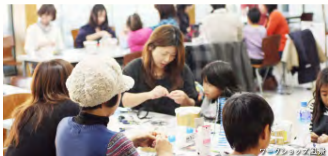
ワークショップ風景

工場地域に位置する山陽印刷株式会社が、地域に新たな「楽しさ・豊かさ」を発信することを目指し、普段は仕事場である社屋にアートを展示して一般開放する。社内の企画・デザインスタッフとアーティストの共同作業により運営され、ワークショップも開催される。