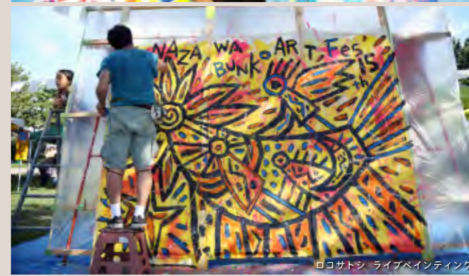
ロコサトシ ライブペインティング