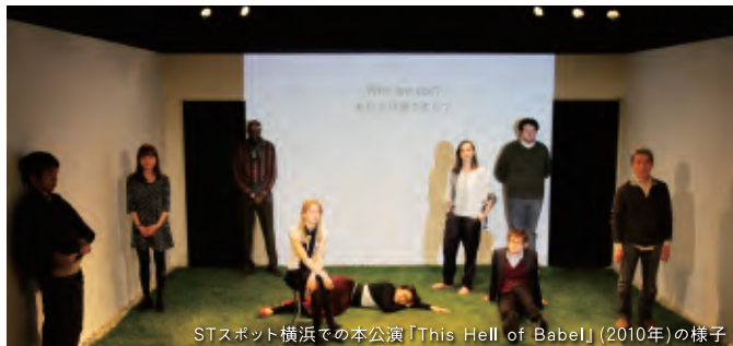
STスポット横浜での本公演「This Hell of Babel」(2010年)の様子

様々な国籍を持つメンバーが所属するマルチリンガル劇団の番外舞台公演。伊勢佐木町、旧外国人居留地、野毛、元町といった地域の、現存する店舗や施設の関係者約100人にインタビューし、地区の歴史の変遷を個人の記憶から辿ったドキュメンタリー演劇を上演する。